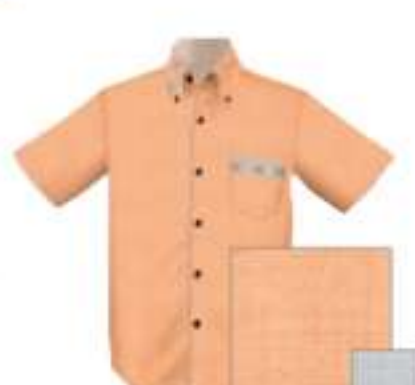
オレンジ×ライトグレー ISM1BDG-P-CHW 30 015