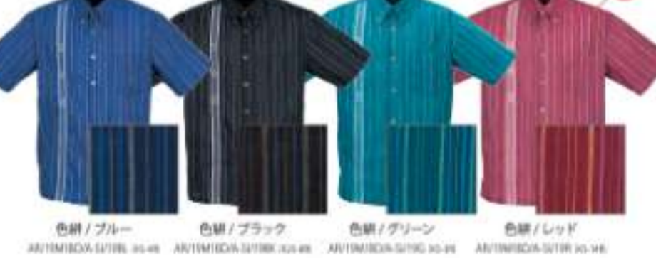
色縞 / ブルー AU19M18DA-S1719L 30-48 色縞 / ブラック AU19M18DA-S1719BK 30-48 色縞 / グリーン AU19M18DA-S1719G 30-48 色縞 / レッド AU19M18DA-S1719R 30-48

豪華な美をベースにランダムに入れた色縞が生み出す大人のストライプ。みんざー縞がシックに際立ちます。