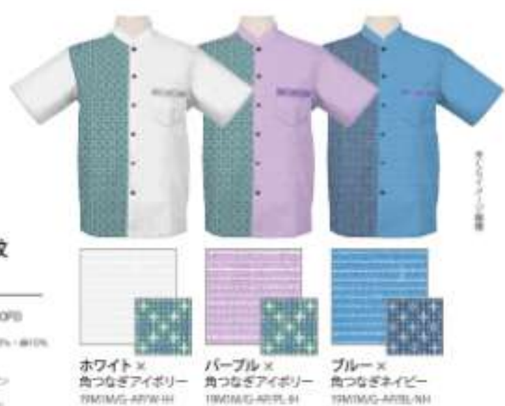
ホワイト× 角つなぎアイボリー ISM1BDG-APWH RY 8-190