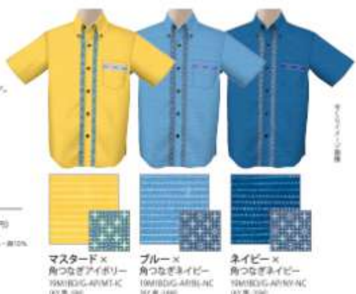
マスタード× 角つなぎアイボリー ISM1BDG-APW-T RY 8-190