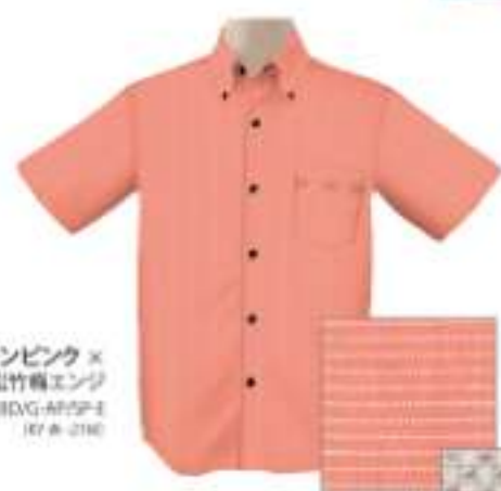
サーモンピンク× 松竹梅エンジ ISM1BDG-APW-E RY 8-190