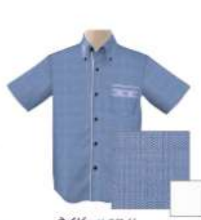
ネイビー×ホワイト ISM1BDG-P-CHW 30 015