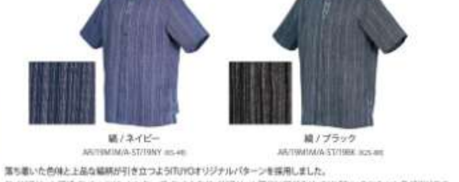
縞 / ネイビー AU19M18A-S1719Y 30-48 縞 / ブラック AU19M18A-S1719K 30-48

落ち着いた色味と上品な縞柄が引き立つよう100%オリジナル/タンを採りました。サイドスリットデザインシャツは、センターポイントと左サイドスリット部分に縫が入り、さりげない中にもセンスが光ります。