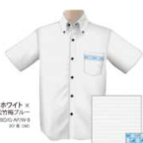
ホワイト× 松竹梅ブルー ISM1BDG-APW-B RY 8-190