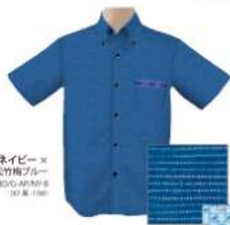
ネイビー× 松竹梅ブルー ISM1BDG-APW-B RY 8-190