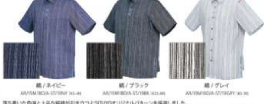
縞 / ネイビー AU19M18DA-S1719F 30-48 縞 / ブラック AU19M18DA-S1719K 30-48 縞 / グレイ AU19M18DA-S1719GY 30-48

落ち着いた色味と上品な縞柄が引き立つよう100%オリジナル/タンを採りました。サイドスリットデザインシャツは、センターポイントと左サイドスリット部分に縫が入り、さりげない中にもセンスが光ります。