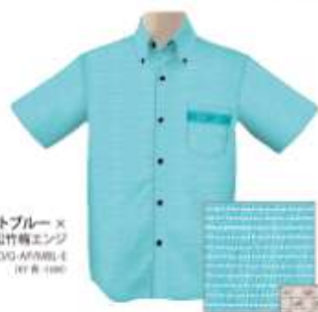
ミントブルー× 松竹梅エンジ ISM1BDG-APW-E RY 8-190