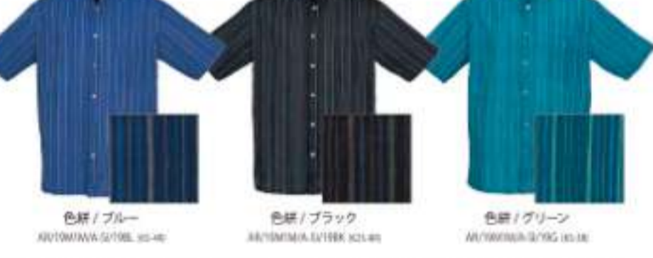
色縞 / ブルー AU19M18A-S1719L 30-48 色縞 / ブラック AU19M18A-S1719BK 30-48 色縞 / グリーン AU19M18A-S1719G 30-48

豪華な美をベースにランダムに入れた色縞が生み出す大人のストライプ。みんざー縞がシックに際立ちます。