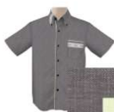
グレーブラック×ライムグリーン ISM1BDG-P-CHW 30 015