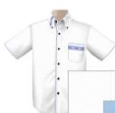
ホワイト×サックスブルー ISM1BDG-P-CHW 30 015

素材：ポリエステル60%・麻40% 製法：ボタン 柄：マオカラー 色：ライトグレー 型：ポリエステル麻 サイズ：SMALL(身長160cm)